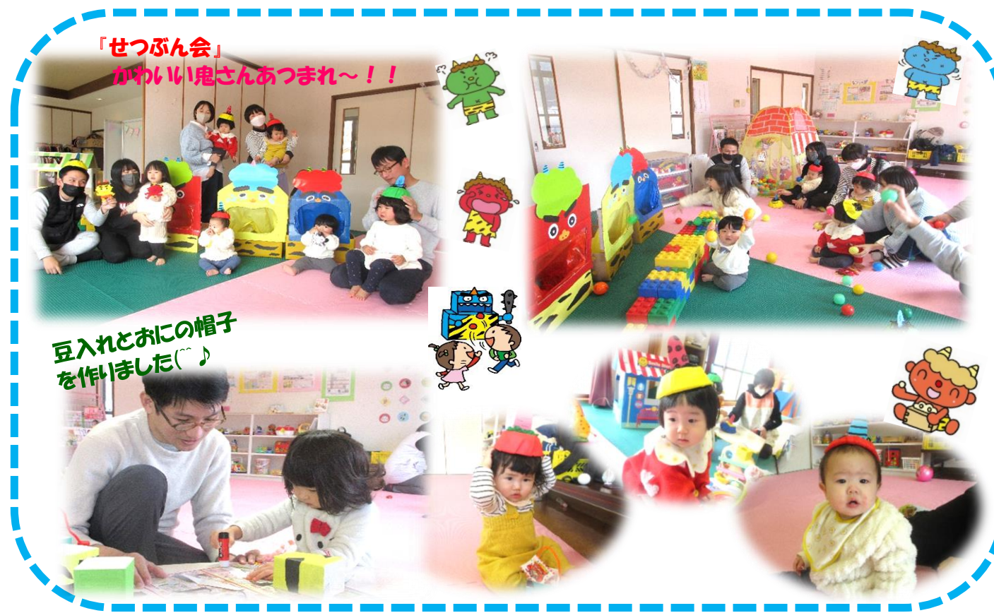
「せつぶん会」 かわいい鬼さんあつまれ～！！